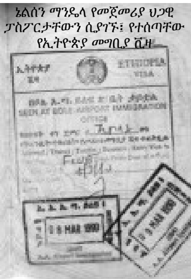
ኔልሰን ማንዴላ የመጀመሪያ ህጋዊ ፓስፖርታቸውን ሲያገኙ፤ የተሰጣቸው የኢትዮጵያ መግቢያ ሺዛ