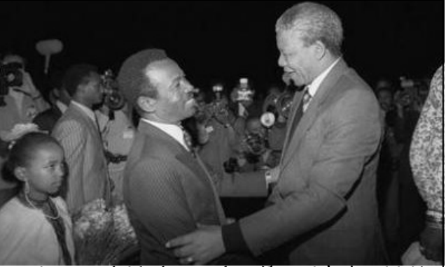
ኔልሰን ማንዴላ ከ እስር ከተፈቱ በኋላ መጀመሪያ ኢትዮጵያን ሲጎበኙ በወቅቱ ገ/ት መንግስቱ ኃይለማርያም አቀባበል ሲደረግላቸው